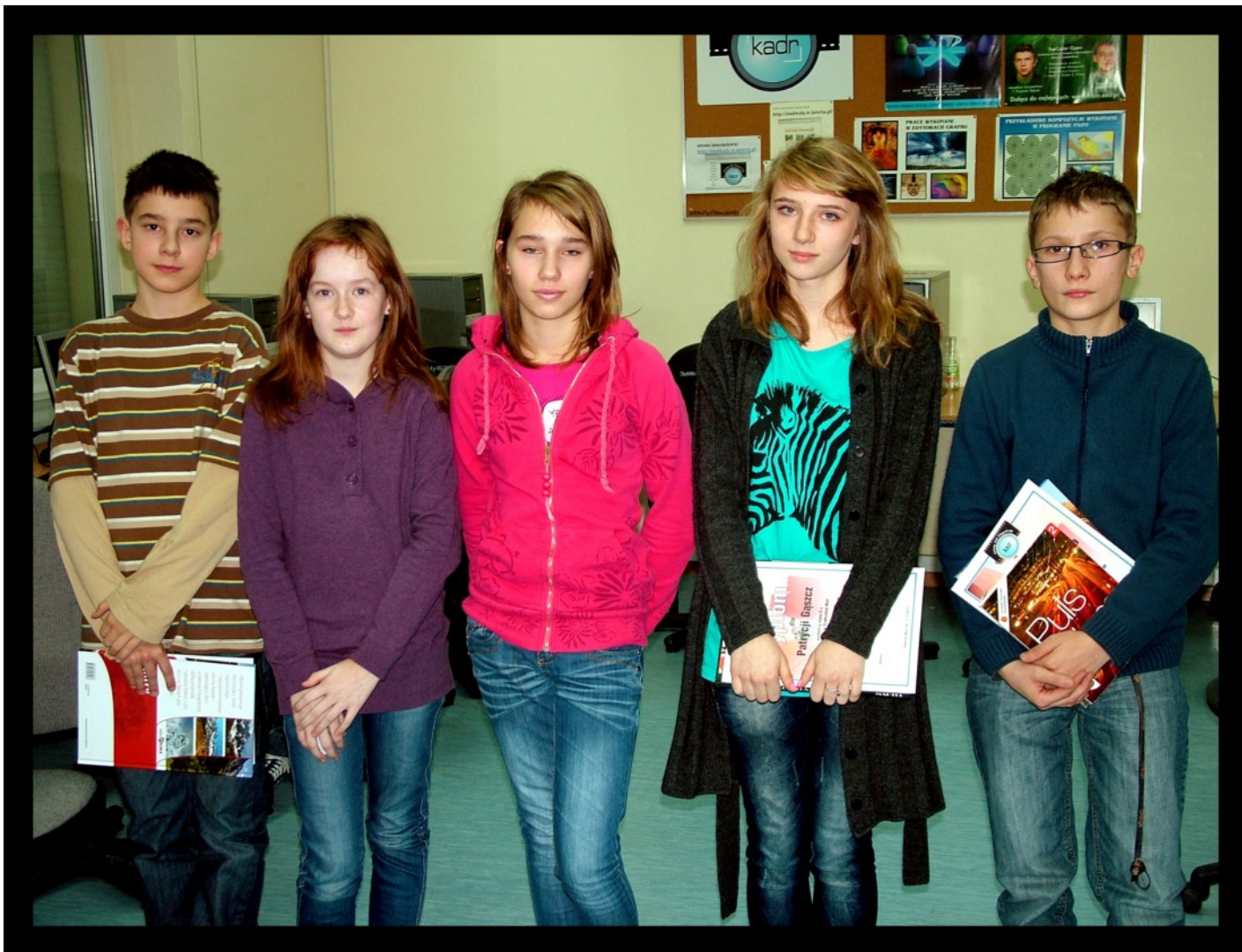
Laureaci konkursu „Architektura w obiektywie”